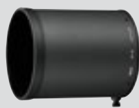
Zonnekap HK-34 (meegeleverd)