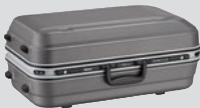
Objectieftas CT-505 (meegeleverd)