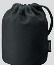
Objectiefbuidel CL-1015 (meegeleverd)