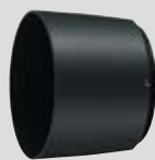
HB-71 zonnekap met bajonetvatting (meegeleverd)