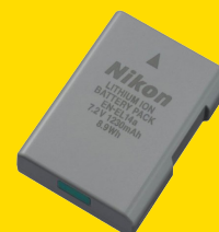
EN-EL14A ACCU (VFB11408)