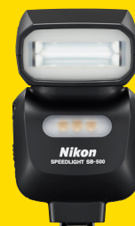
SB-500 SPEEDLIGHT (FSA04201)